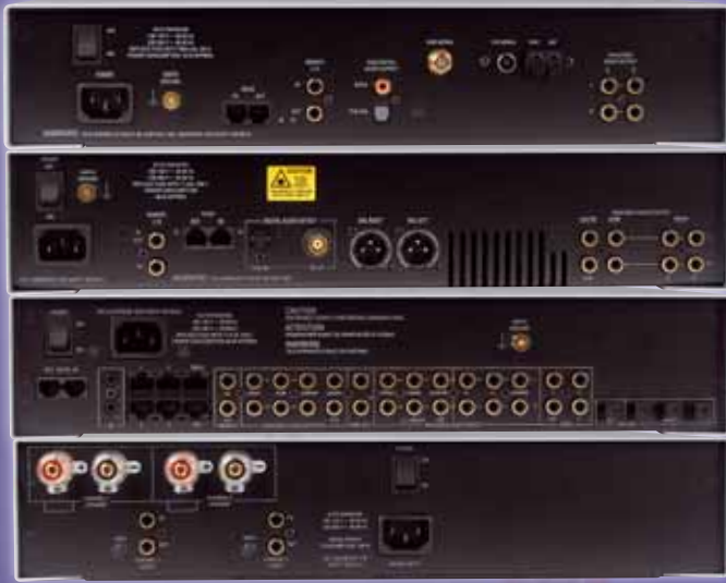
Die fast unübersichtlich vielfältigen Anschlussmöglichkeiten spiegeln das enorme Potenzial der Linn-Anlage wider. Der Interessent sollte sich davon nicht abschrecken lassen: die Verkabelung ist recht einfach und schnell zu bewerkstelligen