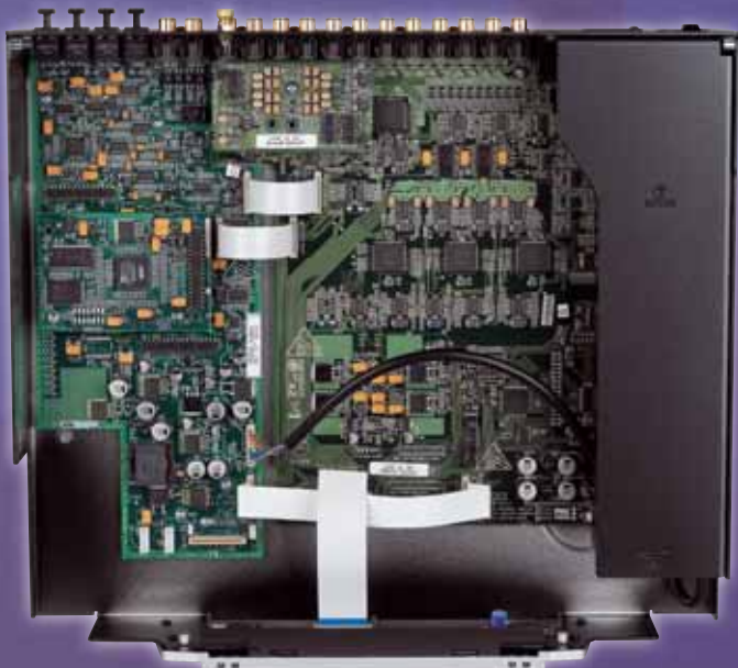
Moderne SMD-Bestückungsanlagen ermöglichen einen enormen Bauteileinsatz auf der Platine des Vorverstärkers, der ja das Herzstück der Akurate-Kette ist. Oben im Bild ist die formidable Phonoplatine zu sehen.

Eingänge, davon je drei optisch und elektrisch ausgeführt. Je einmal koaxial und per Toslink geht es auch aus dem Gerät heraus. Neben den digitalen Anschlüssen kommt das weite Feld der analogen Eingänge. Insgesamt sechs (!) Stereoquellen können angeschlossen werden, darunter, man höre und staune, ein Plattenspieler! Bei diesem Phonoeingang handelt es sich nicht um einen der üblichen Alibi-MM-Preamps billiger Machart, nein, man hat dem Akurate Kontrol die gleiche Platine wie dem Majik-Preamp spendiert, die durch ein geniales Umstecksystem mit drei verschiedenen Verstärkungsstufen arbeitet und damit mit jedem nur erdenklichen Tonabnehmer harmoniert. Die Stereo-Eingänge 1 bis 3 können in einen analogen 5.1-Input umgewandelt werden – dies ist sinnvoll beim Anschluss eines externen Zuspieldgeräts mit sehr hochwertigen Digital-Analog-Wandlern. Allerdings wird es schwer